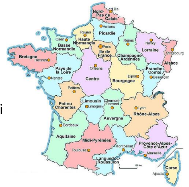
Harta regiunile Franței