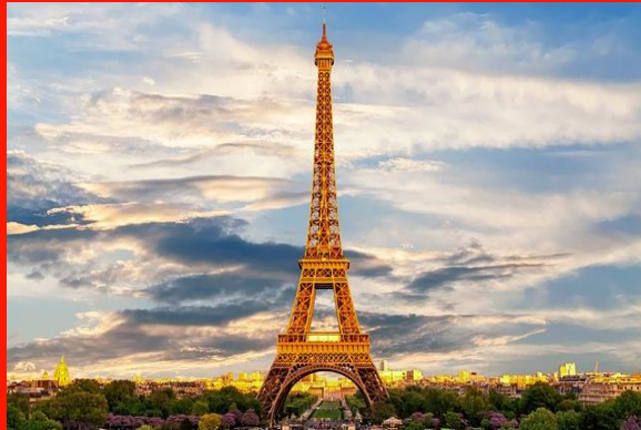
Turnul Eiffel din Paris